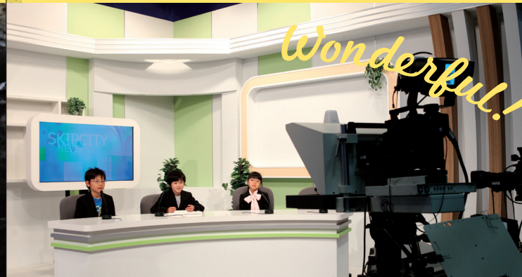
本格的なセットでアナウンサー体験！ニュース番組を作る