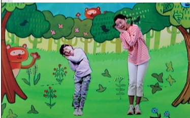
歌のお姉さんと一緒に歌おう