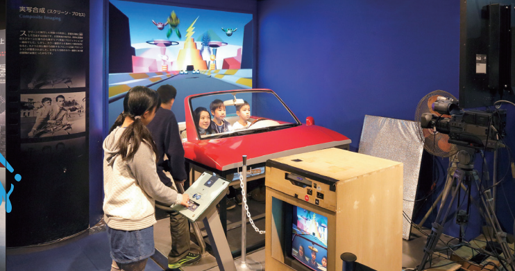
迫力満点！ドライブシーンの撮り方を学ぶ