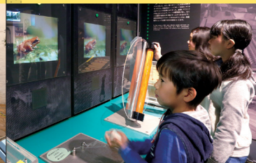
小道具で作る効果音