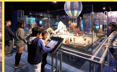
ジオラマで見る映画の撮影現場