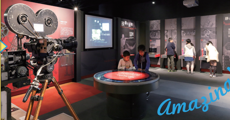
映像が動いて見えるしきみを学ぶ