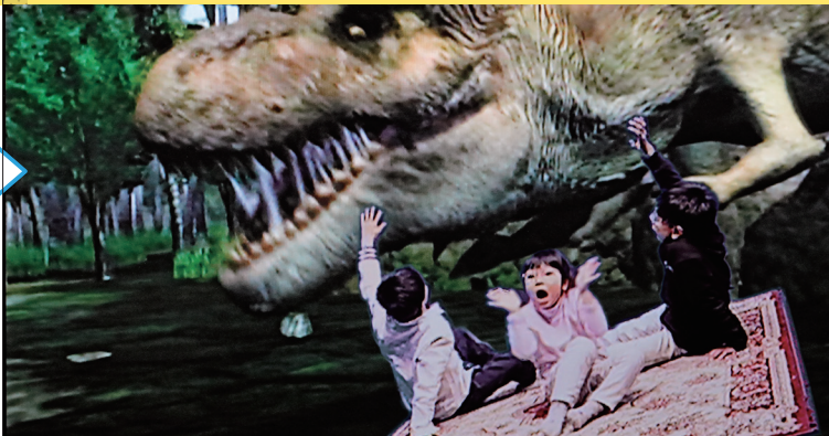
「空飛ぶ魔法のじゅうたん」で恐竜の世界を探検！驚きの冒険シーンを作る