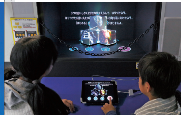
プロジェクションマッピングを作る