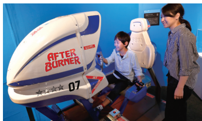
2016年度開催 あそぶ！ゲーム展 ステージ2 ～ゲームセンターVSファミコン～