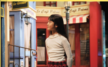
パリの街並みを再現した美術セット