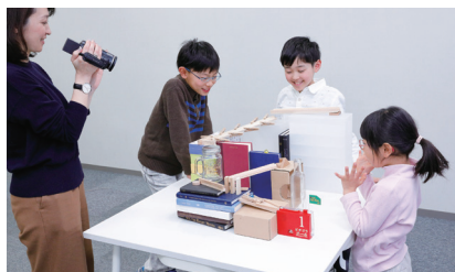
小学生・映像制作教室 ～ビタゴラ装置を作ろう～