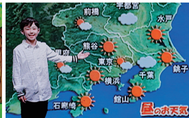
お天気キャスターにチャレンジ