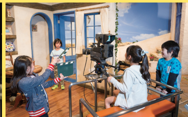
移動撮影にチャレンジ