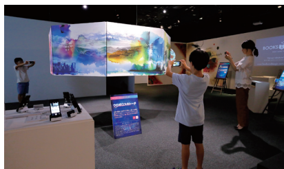
2017年度開催 マジカルリアル ～VR・ARが作り出す不思議体験～

※ 上記展示は過去催されたものです。開催中の企画展はHPをご覧ください。 ※ 映像ミュージアムの入館料で企画展もご覧いただけます。