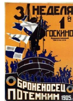
『戦艦ポチョムキン』（1925）ポスター