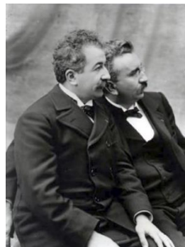
リュミエール兄弟

初めて映画が上映されたパリのグランカフェ（サロン・アンディアン）をイメージした空間で、リュミエール兄弟の功績を紹介する。世界初の撮影・映写複合機である「シネマトグラフ」（複製）の展示と合わせて、『工場の出口』『赤ん坊の食事』など、最初に上映された作品をスクリーンで上映。また、リュミエール兄弟が日本をはじめ世界各地で撮影した映像も展示する。オーギュスト・リュミエールの同級生で日本にシネマトグラフを輸入した稲畑勝太郎についても紹介。