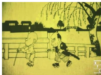
『なまくら刀』（別名『塙内名刀之巻』/1917）