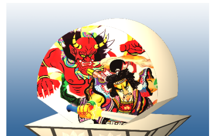
フューチャーねぶた (展示イメージ図)