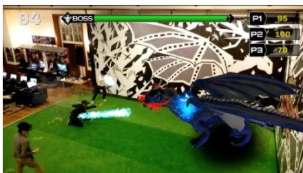
HADO MONSTER BATTLE